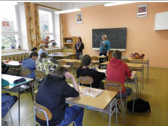
V dubnu proběhla v osmé třídě beseda s pracovníci ÚP Pízeň k volbě povolání

Děti se postupně ve třech skupinách učily, jak se správně chovat k pejskům, jak se o ně starat, jak správně krmit svého psa i jak reagovat na psy cizí. Tento dopolední program provázeli s paní chovatelkou dva cvičení boxeři, na kterých si děti získané vědomosti a dovednosti mohly okamžitě ověřit. Doufám jen, že si naši nejmenší budou tuto zkušenost dlouho pamatovat a ubude tak zbytečných zranění.