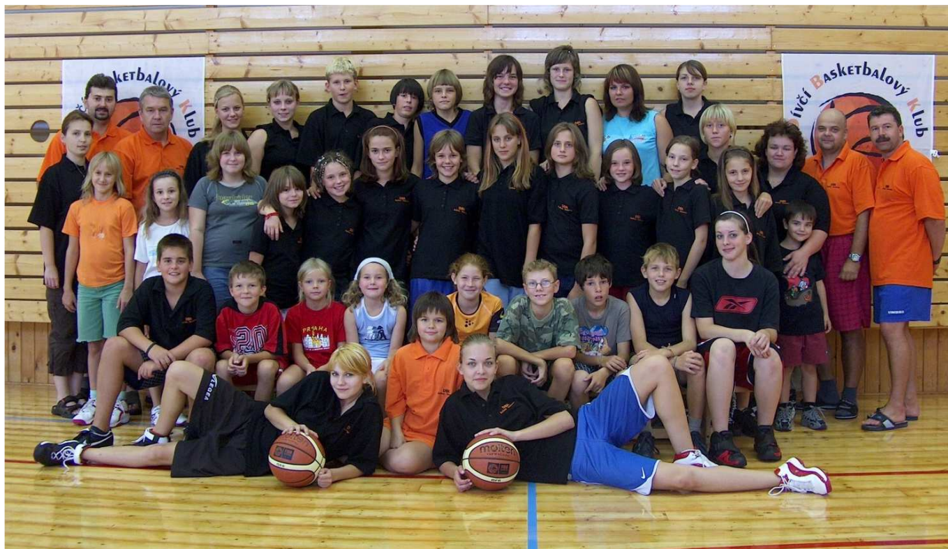
J. Buňka foto archiv klubu