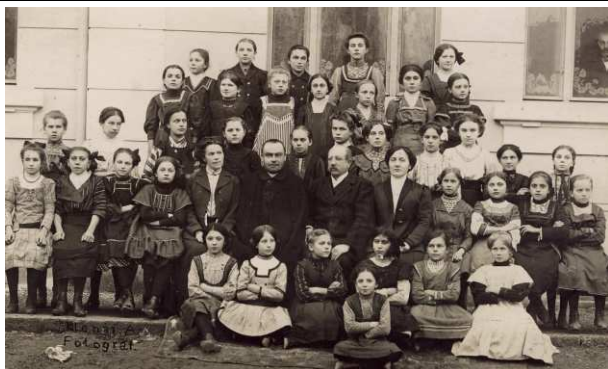
I. ročník měšťanské školy 1911