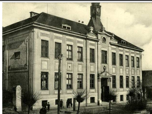
Budova školy kolem roku 1920

V tu dobu má měšťanská škola již tři ročníky a je úplná. Jako smíšená dívčí a chlapecká měšťanská škola pak slouží ke cti a slávě od roku 1919.