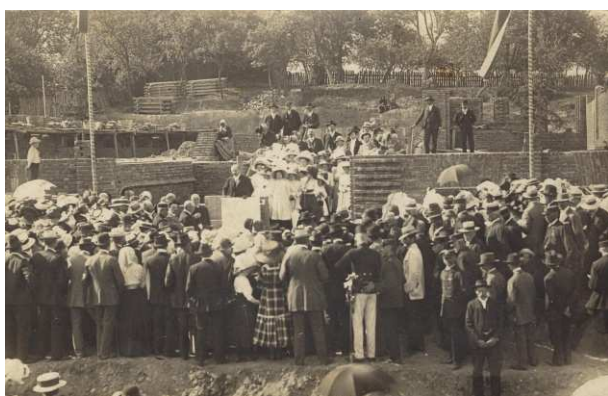
Položení základního kamene ke škole r. 1912