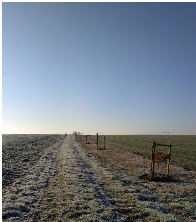
Alej tonoucí v mlze.