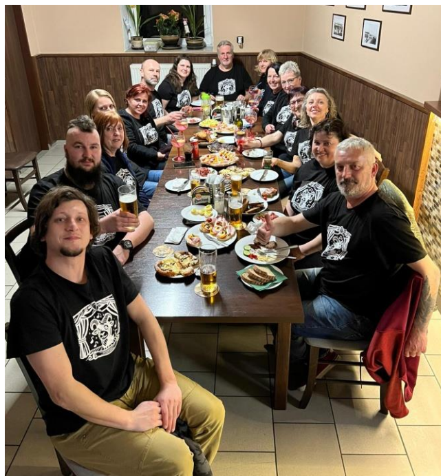
DS Kozlák Kozlany

Tímto se s vámi prozatím loučíme a těšíme se na další společně strávené divadelní zážitky.