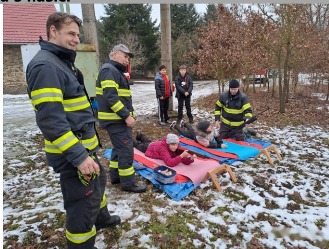
Vaši hasiči Kožlany

Dobrovolní hasiči děkují všem, co s námi vyrazili na trasu. Těšíme se na Vás při další akci. Přijďte se s námi bavit, poznat nové kamarády a třeba se s námi zapojit do přípravy dalších akcí. Budeme se těšit.