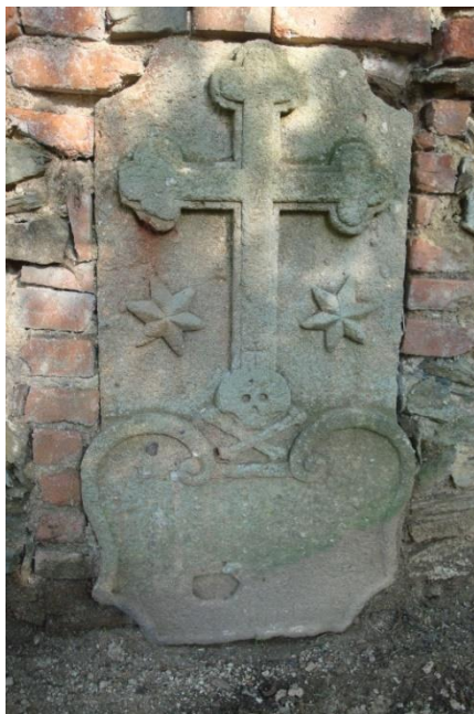
Pohled na náhrobní kámen osazený v ohradní zdi po očištění jeho paty a odhalení nápisu. Na kameni Golgota a kříž.

„ Dušiček “ 1913. Úprava vyžadovala přes dva tisíce korun, ač dovoz písku a kamene obstarali zdarma místní občané. Při vyměřování cest přišel ředitel školy k úrazu – zlomil si nohu. Opravený hřbitov slouží škole částečně jako zahrada botanická.... “ Následující rok byla v parku Květinová slavnost, kterou pořádala měšťanská škola.