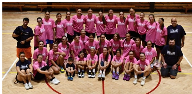
Účastnice společného soustředění U14 + U15 v Plasích.